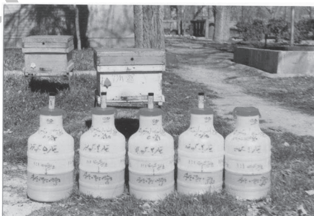
شکل ۱- شربت های حاوی سطوح مختلف ویتامین ث

این آزمایش از اوایل بهار ۱۳۷۹ آغاز شد و کلنی های تحت آزمایش با توجه به میزان جمعیت (۱۰ - ۸ قاب)، پرورش نوزاد و ذخیره غذایی هر کندو تهیه گردیدند. سپس پیوند لارو جهت تولید ملکه های خواهری از اوایل تیر ماه آغاز شد و پس از تولد تدریجی ملکه ها و جفت گیری و شروع تخم ریزی آنها در نوکلئوس ها، ملکه های خواهری جوان به کلیه کلنی های آزمایشی معرفی گردیدند. در اوایل پاییز یکسان سازی کلنی ها از نظر ذخیره غذایی عسل و گرده و جمعیت انجام گردیده و از طریق قرعه به پنج گروه پنج کندویی تقسیم گردیدند و به هر کلنی مقدار ۱۰۰ گرم کیک جانشین گرده با پودر کنجاله سویا جهت تحریک ملکه به تخم ریزی بیشتر و قوی نمودن کلنی ها جهت گذراندن راحت تر زمستان داده شد. سپس کلنی ها در تاریخ ۸/۸/۷۹ بسته بندی گردیده و آماده زمستان گذرانی شدند. پس از زمستان گذرانی مجدداً کلنی ها از نظر اندک گرده باقیمانده که دارای ارزش غذایی خیلی کمی می باشد یکسان سازی گردیده و آماده تغذیه گردیدند. تغذیه کلنی ها با شربت شکر یک به یک حاوی سطوح مختلف ویتامین ث (۷۵۰ ppm = تیمار یک، ۱۵۰۰ ppm = تیمار دو، ۲۲۵۰ ppm = تیمار سه، ۳۰۰۰ ppm = تیمار چهار و ۰ ppm = تیمار پنج یا گروه شاهد) در قالب یک طرح کاملاً تصادفی با پنج