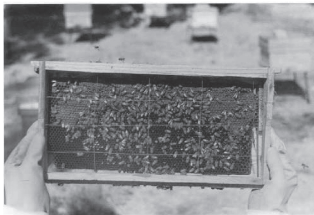
شکل ۲- نحوه اندازه گیری عسل باقیمانده در کندو توسط قاب شبکه بندی شده